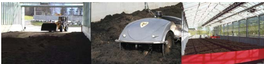
Ejemplo de carga y distribución de los lodos deshidratados mediante el "Topo eléctrico"®

En las instalaciones de Thermo-System el secado de lodos se efectúa normalmente mediante un proceso por lotes.