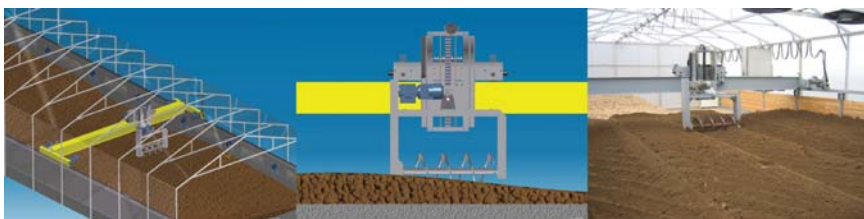
El "Gestor de lodo" (elaborado en cooperación con ACAT)

Durante el secado el "Topo eléctrico" ® / "Gestor de lodo" no solamente realiza la distribución uniforme de los lodos en el interior de la cámara, sino sobre todo garantiza una buena aireación y mezcla de los lodos, consiguiendo así las condiciones óptimas para el seca-