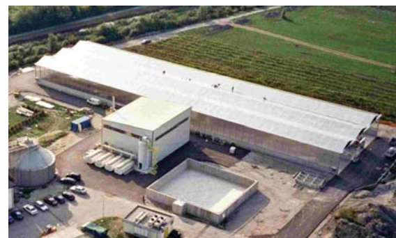
Planta de secado solar de lodos de depuración de Antigua - Fuerteventura