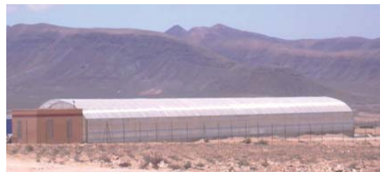
Planta de secado solar de lodos de depuración de Antigua - Fuerteventura

Gracias a la regulación climática y la optimización energética de todos los componentes, el consumo eléctrico es mínimo. Con plantas de secado puramente solares el consumo eléctrico es aproximadamente 20-30 kWh por tonelada de agua evaporada. Por tanto, los gastos de electricidad suponen aproximadamente 1-3 euro/t